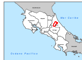
Diagrama de Ubicación